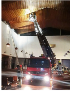
Die Leiter steht in der Kirche.