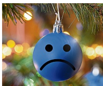
Für viele wird Weihnachten zum Stresstest. IMAGO

Die Atemübung: Halten Sie Ihren Atem kurz an. Danach atmen Sie langsam wieder aus. Stellen Sie sich vor, wie Wellen der Entspannung vom Scheitel bis zu den Zehenspitzen durch Ihren Körper gehen. KNA